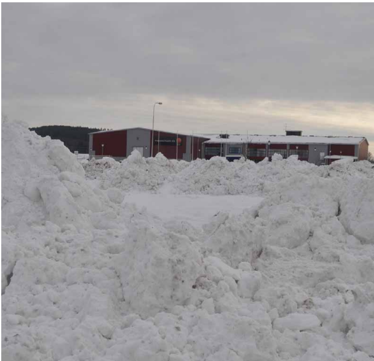
Inte i Fryken, utan alla lastbilar har fått köra längre från Sunne centrum för att tömma sina lass med snö. Här är det ena stället, norr om Sporthallen.